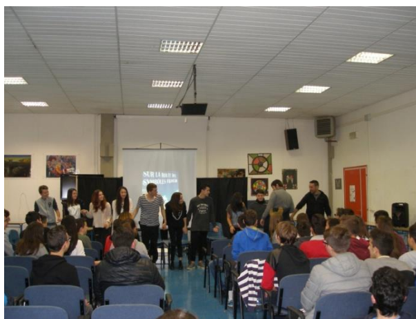
Istituto Comprensivo Spoleto 2, Sede Pianciani, le classi seconde e terze della scuola secondaria di primo grado