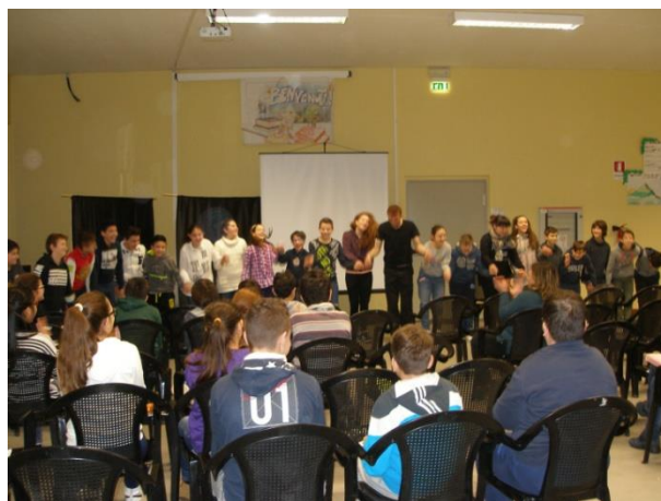
Istituto Comprensivo Spoleto 2, Plesso Manzoni, le classi prime e seconde sezioni A-B