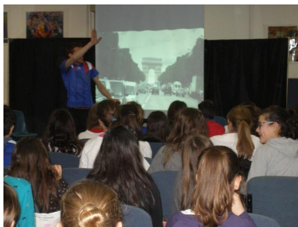
Istituto Comprensivo Spoleto 2, Sede Pianciani, le classi quinte della scuola primaria, con le prime della scuola secondaria di primo grado